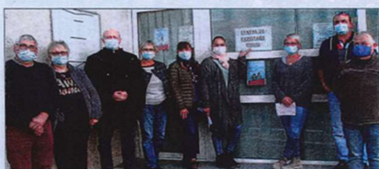
Le centre de dépistage Covid est ouvert.

Face à la recrudescence des cas de Covid sur la région, le CCAS de la Commune de Saint-Julien le Montagnier a souhaité mettre en place un centre de dépistage. Celui-ci répond à plusieurs sollicitations, notamment celle des infirmières exerçant sur la commune et celle des administrés qui sont pour certains distants de près de 20 kilomètres du centre le plus proche (Vinson). Une réflexion primale sur la faisabilité de cette opération a été menée par Em-